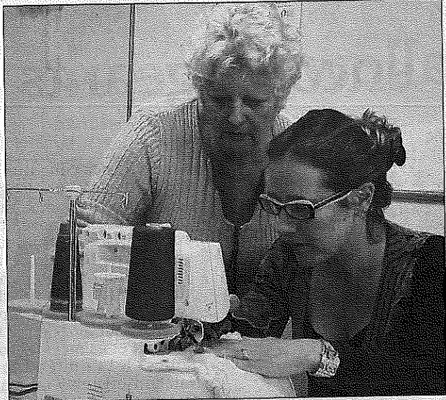
■ Petite démonstration.